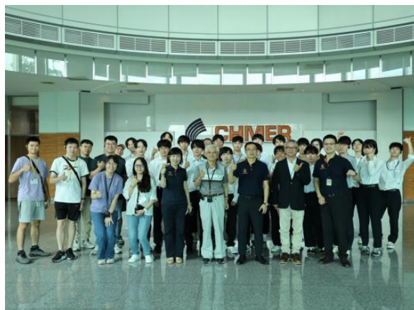
2023廣島大學參訪。