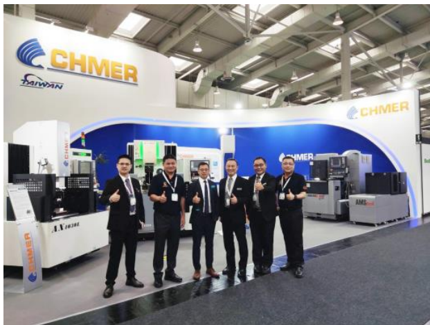
2023漢諾威世界工具機展EMO團隊合照。