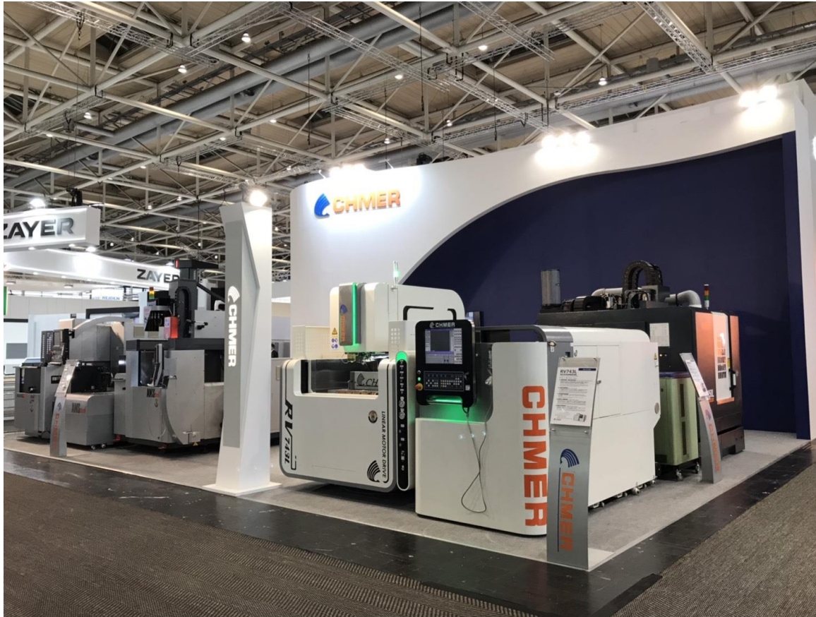
▲ 慶鴻機電於 EMO 展以 CHMER、AMS 雙品牌精密設備大秀創新實力。

工機」；AMS 品牌、性能優異且外觀出眾、深耕歐洲市場的「AW5L-AMS 線性馬達線切割機」；滿足航太產業所需特殊材質加工、特殊多角度加工等之「AD5L-AMS 高速深孔加工機」。