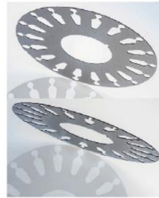
◆ 馬達鐵芯片 材 質：矽鋼 厚 度：0.5mm 加工時間：1min45s