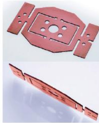
◆ 散熱片 材 質：紅銅 厚 度：0.8 mm 加工時間：3min20s

慶鴻機電重視核心關鍵技術發展，期以自製化、MIT 加強台灣產品在全球的競爭力。「高精密磁浮雷射切割機-PL 系列」以「創新、智慧、效益、環保」的設計理念出發，擁有多項專利，實現精密切割：採重心驅動的懸臂式結構(專利)，提升加工移動靈活度及加工精度；搭載慶鴻自行研發自製線性馬達驅動(專利)，提供絕佳的運動精度、達成高效率加工；雷射加工頭部吸塵裝置(專利)重視加工安全及環保。