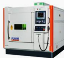
慶鴻以45年精密零件與模具加工設備製造優勢，創新研發「PL6880-高精密磁浮雷射切割機」，更榮獲第29屆台灣精品金質獎最高榮譽肯定。

慶鴻機電以自有品牌CHMER行銷全球，致力成為非傳統加工技術解決方案的世界級領導品牌；除現有「線切割機、放電加工機、深孔機、高速加工機」四大類產品外，推出高精密、高CP值的雷射切割機，亦投入電化學加工設備開發，以全方位產品線邁入CHMER非傳統加工新時代。✎