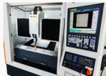
搭配慶鴻集團自行研發製造之控制器，重視雷射切割之結構、飛切等智慧化功能，PL系列雷射切割軟體全權擁有，追加軟體新功能容易，積極提升加工便利性。