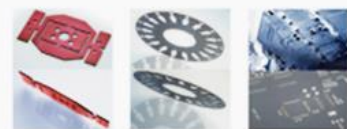
◆ 散熱片 材 質：紅銅 厚 度：0.5mm 加工時間：3min/23s ◆ 高精密之片 材 質：鈔銀 厚 度：0.5mm 加工時間：2min/45s ◆ 電鍍板 材 質：不銹鋼 厚 度：0.2mm 加工時間：72min/45s

慶鴻機電重視核心關鍵技術發展，期以自製化、MIT加強台灣產品在全球的競爭力。「高精密磁浮雷射切割機-PL系列」以「創新、智慧、效益、環保」的設計理念出發，擁有多項專利，實現精密切割；採重心驅動的懸臂式結構(專利)，提升加工移動靈活度及加工精度；搭載慶鴻自行研發自製線性馬